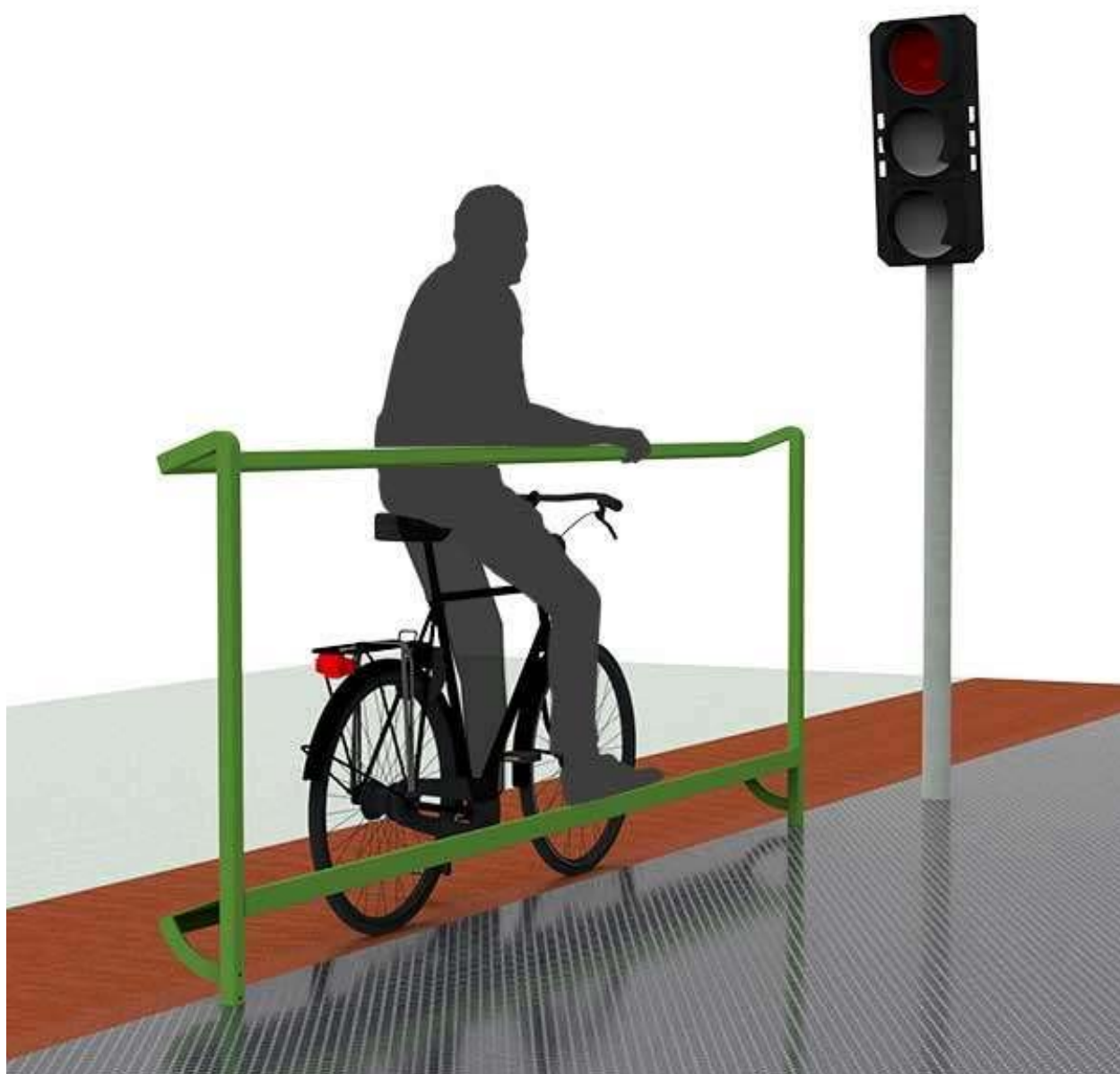
Figure 1: FalcoSupp- vue générale