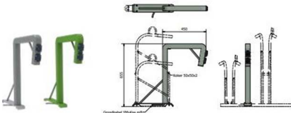
Figure5. Ideal 2.0 VAE