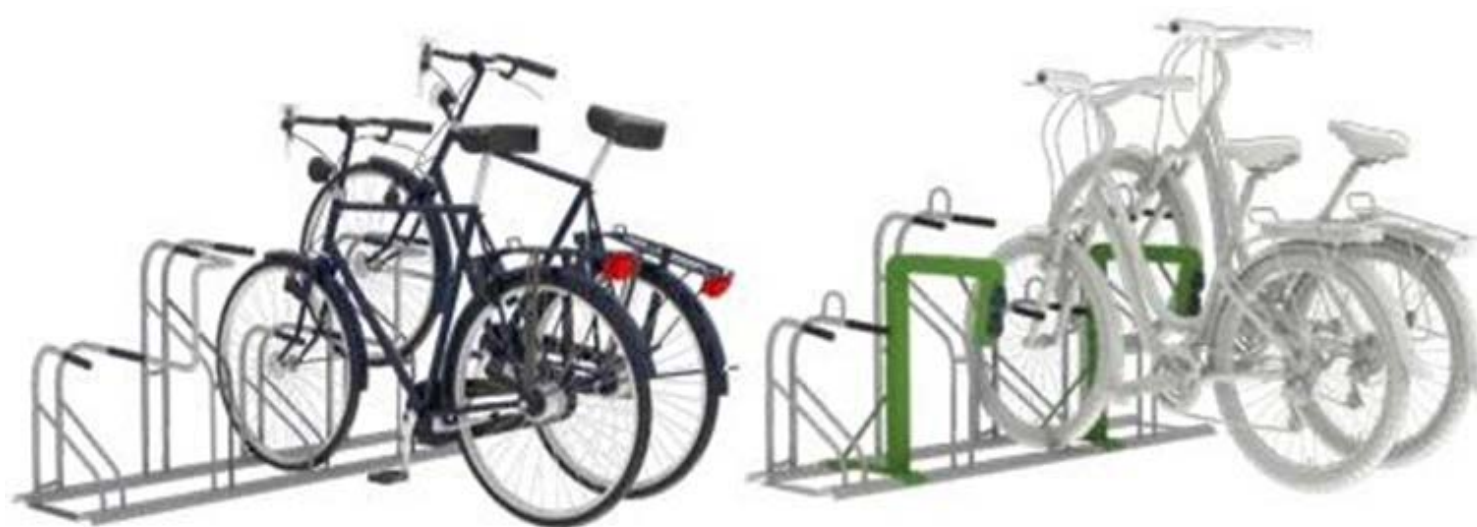
Figure 1. Ideal 2.0 et ideal 2.0 VAE