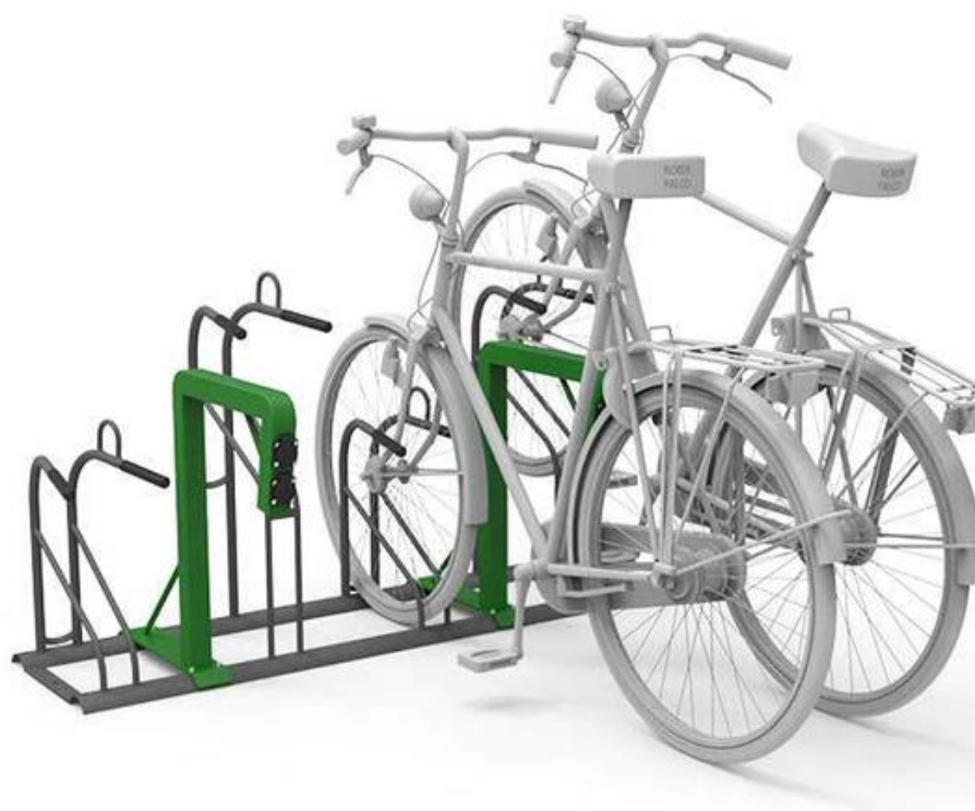
Figure 2. Ideal 2.0 – détail sur le système de sécurisation cadre + roue