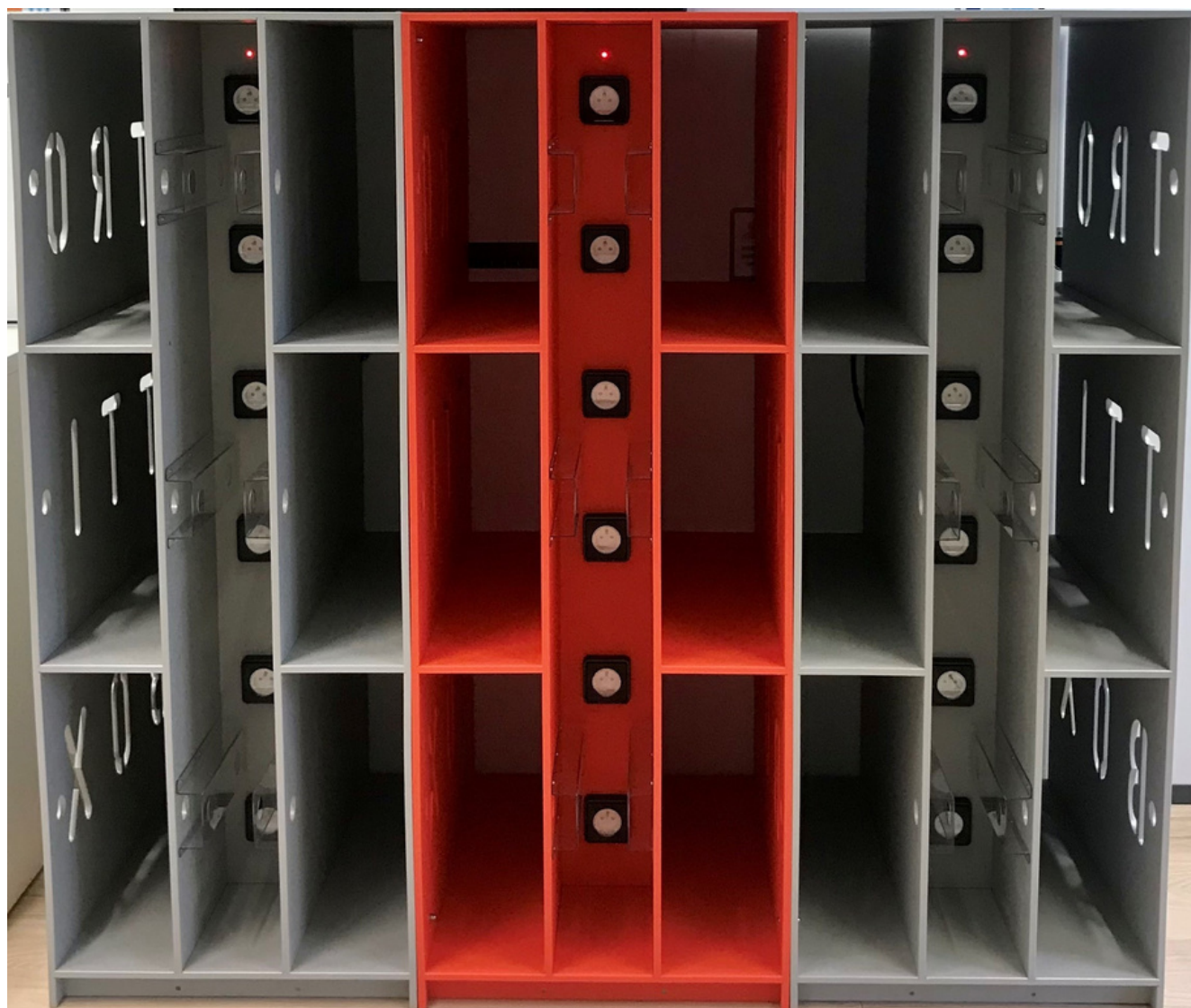
Figure 1: casier trottibox - vue générale