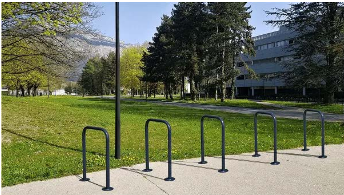
Figure 1: Arceau U inversé - vue générale