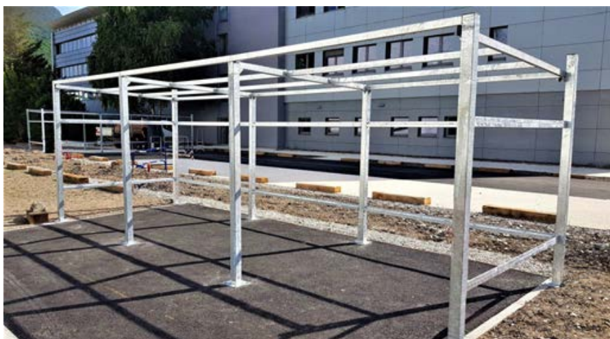
Figure 4. Montage d'un abris vélo de 9m