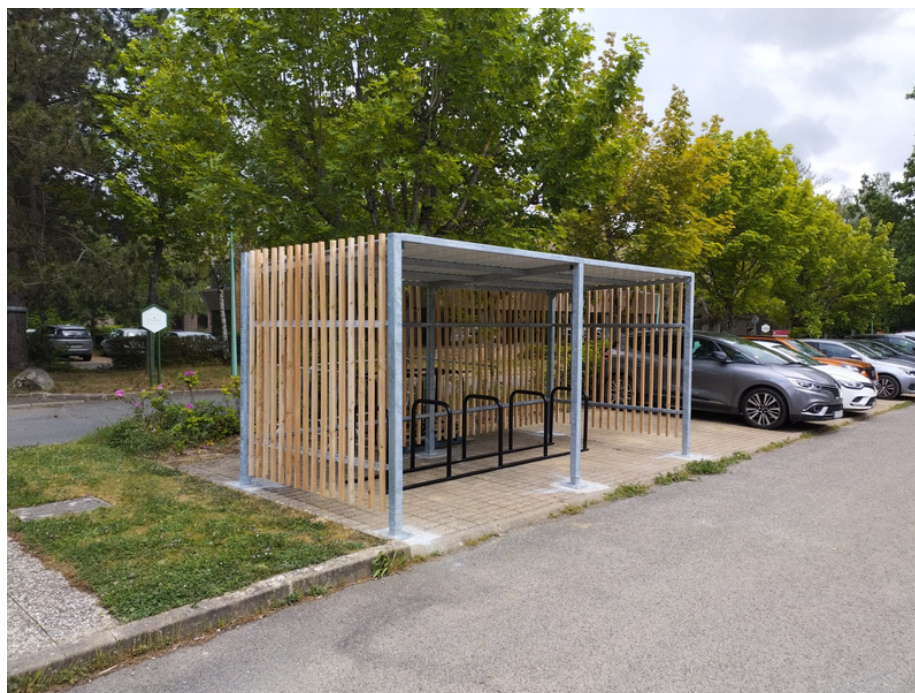
Figure 2. Installation de l'abris vélo Clairière