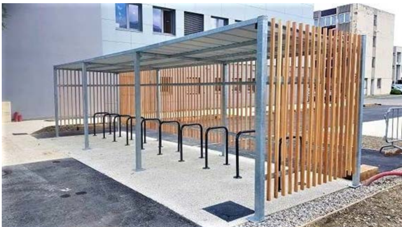
Figure 1. L'abris vélo "Clairière" monté